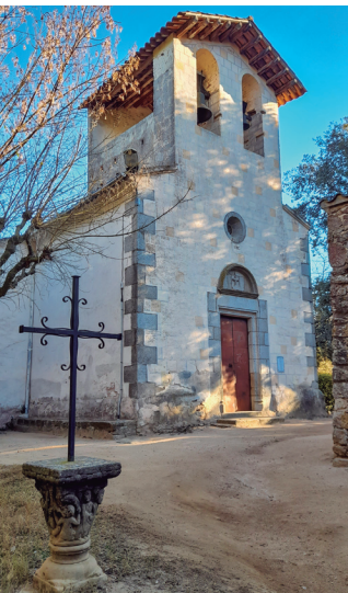
Església de Sant Esteve d'Olzinelles