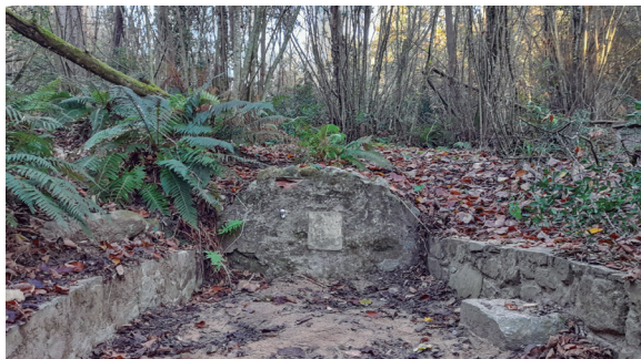
Font del Rector

De la font del Rector el viaró ascendeix fins a l'església de Sant Esteve d'Olzinelles, un temple d'origen romànic, documentat el 1083, que va donar lloc a la parròquia, amb el nom aparegut per primer cop el