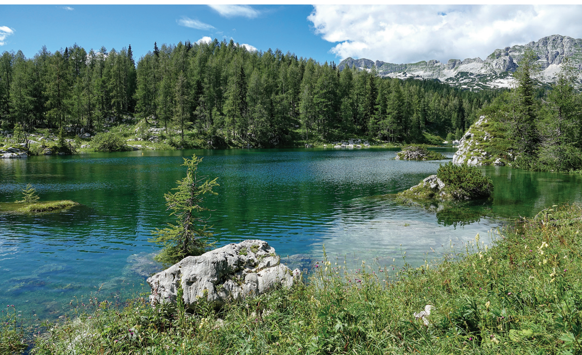
Llac Dvojno a la vall dels 7 llacs, Triglav (Alps Julians), Eslovènia.