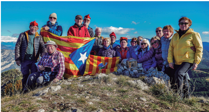
Grup al cim de Turp.

És hora de fer balanç i hi ha unanimitat en dir que la comissió ha estat de 10, pel pic escollit, per la seva accessibilitat, pel lloc elegit per a l'estada (un altre 10 a Ca l'Agustí) i pel dia tan bo i diàfan que van encarregar.