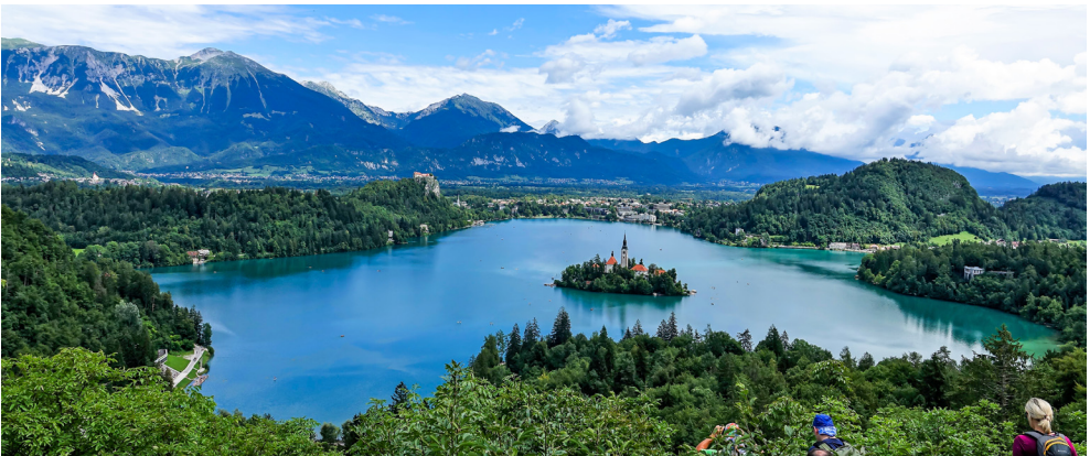
Llac Blejsko jezero a Bled.

A una marxa lleugereta (130/140 Km/h) ens vam encaminar, amb les dues furgonetes Renault, cap a Ljubljana. Un cop instal·lats al primer hotel de concentració, i atesa la situació meteorològica passada per aigua dels últims dies i la previsió per als propers, els nostres «trainers» ens van proposar uns canvis per als dos primers dies, i fer així més factible l'inici de l'en-