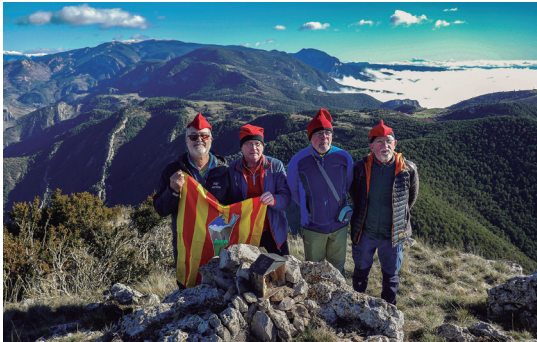
Comissió del Pessebre al cim de Turp.

pista que duu al coll de la coma de Turp (1.479 m) des d'on iniciem la pujada, ja més dreta, pel seu vessant nord.