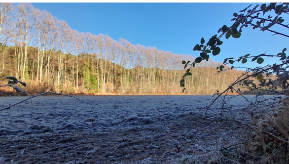
Camps entre el SL C-79 i la riera d'Olzinelles

Just quan el SL C-79 arriba a tocar altra vegada la carretera, podem desviar-nos un moment per anar a veure els forns de pega de la masia de can Valls, i també la font de la Pega. Hi ha una fita indicadora que ens mostra la direcció. La pega és una substància obtinguda de la destil·lació del pi i l'alzina, de la qual també s'obtenia la brea. Tenia usos diversos, tant podia servir per immobilitzar i curar peus d'animals, com per caçar alguns ocells, art prohibida actualment. La pega també s'usava com a combustible per a l'enllumenat públic i per impermeabilitzar estris. Aquests tres forns de pega que trobem aquí són de ceràmica en forma ovalada, un d'ells molt ben conservat. La tradició explica que són originaris del segle XI. Tornem al SL C-79, i prosseguim per un deliciós viarany fins a arribar a la font del Rector. Es tracta d'una bonica font, arranjada per darrera vegada el 1989, amb dos bancs de pedra a banda i banda, amb un polsador per on, quan la sequera ho permet, raja aigua d'una mina propera.