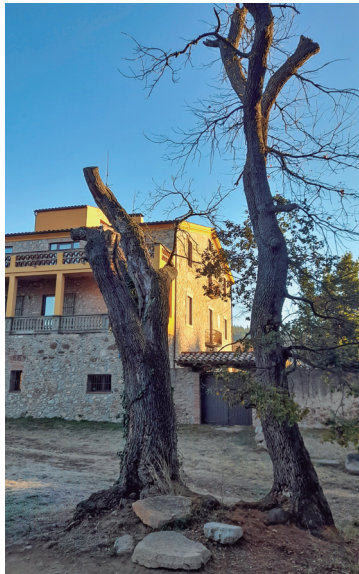
El que resta del roure de can Draper, davant mateix del mas.