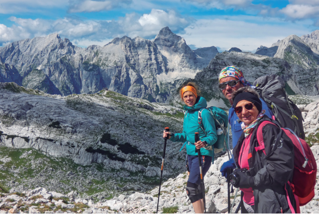
Vistes des de la vall dels 7 llacs.

tres per por d'estar-ho, i la resta resant per la curació de tots. Després d'esmorzar i dels primers estiraments a la terrassa, amb els cotxes anem al punt de sortida del tresc d'avui.