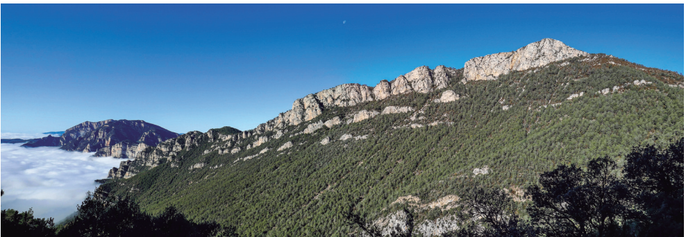
En primer terme la carena i el pic de Turp, a l'esquerra la serra d'Aubenç.

Desplaçats amb cotxe fins al pla de la Llacuna (1.365 m), comencem l'excursió voltant el cap de la Pinyassa pel seu vessant oest i ben aviat gaudim d'unes magnífiques vistes al mar de núvols del qual sorgeixen el petit massís de Sant Honorat i el més gran de la serra d'Aubenç. El camí transcorre per una pinada, que en aquestes contrades s'alterna entre pinassa i pi roig amb boix, i aviat se'ns obre una finestra amb la visió del pic de Turp i la seva cinglera que davalla cap a ponent. Tot seguit passem per la font de la Pinyassa, que no sabem veure arran de camí a causa de la sequera que estem patint, i pugem suaument fins al coll de la Travessa (1.390 m). Tenim enfront mateix el pic pel seu vessant sud i ara cal enfilat la