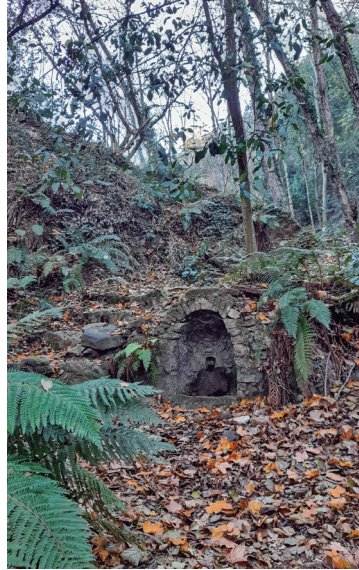
Font de l'Aranyal

Sant Celoni és un puixant municipi de quasi 20.000 habitants, amb força indústria, travessat per importants vies de comunicació com l'autopista AP-7, la carretera C-35, i les línies de tren d'ample convencional i l'AVE. Tot i això, aquest municipi ha sabut mantenir la seva personalitat pròpia, tant a la capital municipal, com en alguns dels antics pobles, com en el cas d'Olzinelles, una vall on encara es pot passejar amb tranquil·litat i apreciar exemplars d'arbres monumentals, gaudir de la natura i de les restes d'antigues feines bosqueroles, com els pous de glaç i els forns de pega. Saber mantenir el valor ecològic del lloc, amb les fonts, les masies, els vells ponts i basses, i l'església d'origen romànic de Sant Esteve d'Olzinelles, és una mostra de sostenibilitat com a societat, un bon exemple de conservació per deixar als nostres fills i nets un món on valgui la pena viure. Cal que aprenguem a organitzar les nostres activitats socioeconòmiques mantenint la biodiversitat i els ecosistemes naturals.