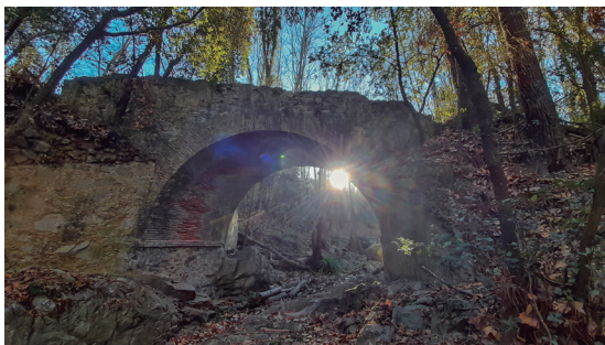
Pont de can Plana

El camí senyalitzat pren ara direcció llevant, seguint com sempre la riera d'Olzinelles, vorejant camps treballats per les tasques agrícoles, que estan completament gebrats quan hi passem nosaltres.