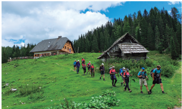
Refugi Koca na Planini pri Jezeru.