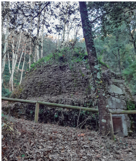
Pou de glaç de can Draper

El nostre recorregut inicial és paral·lel a la riera fins que ens desviem un moment per aproximar-nos al pou de glaç de can Draper. La indústria del glaç va ser molt important al Montnegre fins a l'aparició de les primeres fàbriques de gel. El pou de glaç de can Draper va ser construït el 1771, tal com indica la data inscrita a la llinda de la porta. És una estructura de planta circular, de 12 m d'alçada (tot i que aproximadament la meitat són enterrats), amb coberta semiesfèrica de totxo, aixecada amb carreus estrets disposats en filades; un bon exemple de pou de glaç del Montnegre. El funcionament era senzill: el gel de l'hivern s'embolcallava en palla i es guardava al pou, que es recobria amb branques i fulles fins que amb l'arribada de la calor es reobria per començar amb el lucratiu comerç.