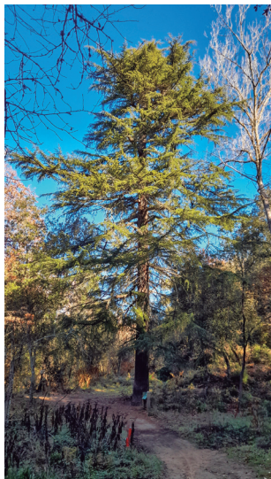
Cedre de Can Valls

durant segles, pel seu valor ambiental però també simbòlic. Continuem la senyalització del SL C-79 fins a arribar una desviació que ens porta a la bassa de l'Aranyal i els seus plàtans gegants ( Platanus hispanica ). Tornats al camí, i avançant a nord, trobem el gran cedre de can Valls. Els cedres ( Cedrus atlantica ) són originaris de la serralada de l'Atlas (Marroc), que a Catalunya foren plantats com a arbres ornamentals, com és el cas d'aquest exemplar que es calcula fou plantat el 1920. Té una alçada de 21 m i un diàmetre de capçada de 16 m, el que el converteix en el cedre de majors dimensions del municipi de Sant Celoni.