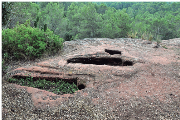
Tombes antropomòrfiques. Totes les fotos són de Leonci Canals

Tot seguit arribarem a la magnífica església romànica de Santa Maria de Cervelló amb algunes modificacions dels segles XVI i XVIII. Al 904 ja hi ha notícies d'una cessió de Guifre II de Barcelona a Sant Cugat on es dona testimoni d'aquesta església, que va tenir al llarg del s. X i XI una relació complicada entre el monestir de Sant Cugat i el castell de Cervelló. En origen sembla que la construcció estava dedicada a la Santa Creu, canviant l'advocació a Sant Esteve durant el s. XI. Un altre canvi d'advocació data de principis del s. XX, quan es va construir la nova parròquia de Sant Esteve al nucli de la població actual, canviant a Santa Maria