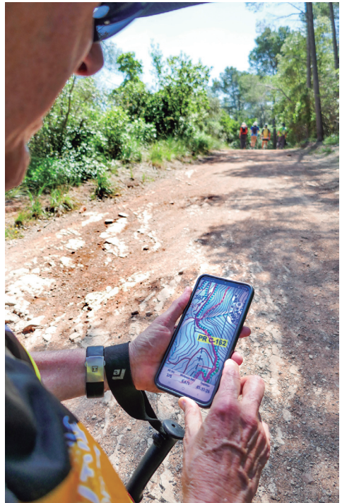
Seguint una ruta amb el track.

l'havia gravat havia d'haver comprovat que no estava bé i que et duia a enfilart-te per una paret sense camí. Els GPS i els tracks que generen són molt més segurs i molt més sostenibles que anar pintant la muntanya o clavant-li cartells. Però és com tot, cal saber qui l'ha generat i per què. Una vegada algú va criticar un dels meus tracks perquè anaven pel mig de la muntanya i no hi havia camí: no havien entès que l'important era localitzar les coses (els waypoints ) que m'interessava, i que s'hi havia d'anar com bonament poguessis. Confondre un track amb un camí et pot sortir molt car!