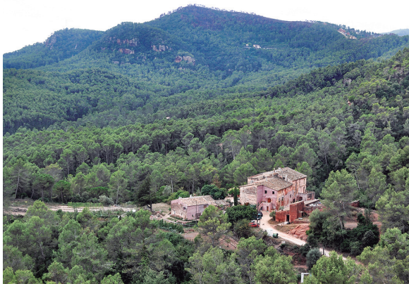
En primer terme Can Sala de Baix, al fons Can Sala de Dalt, puig Vicenç i la penya del Cucut.

Just abans d'arribar al mas, deixem la pista per agafar un corriol que surt a la nostra esquerra i empalma altre cop amb la pista que va cap a Torrelles, d'aquesta manera passem pel bosc i ens estalviem un tros de pista. Un cop a la pista hem de seguir