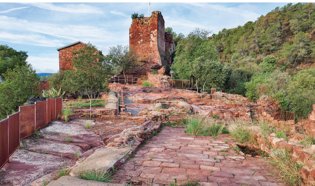
Castell de Cervelló.

setjà i conquerí el castell. El segle XIII va haver-hi un estira-i-arroña constant entre la baronia i la monarquia, després va anar passant per diferents mans fins que va ser enderrocat el 1714 per ordre del rei Felip V durant la Guerra de Successió (5).