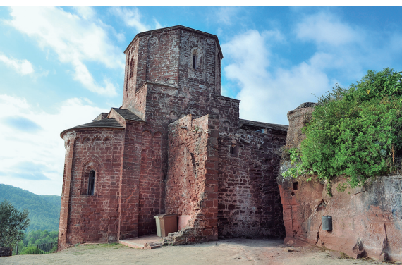
Església de Santa Maria de Cervelló

l'any 1580 durant una reforma projectada per Leonard Bosch, amb la qual també es van integrar dues capelles laterals. Al s. XVIII, en una altra fase d'ampliació, s'hi van afegir dues capelles més.