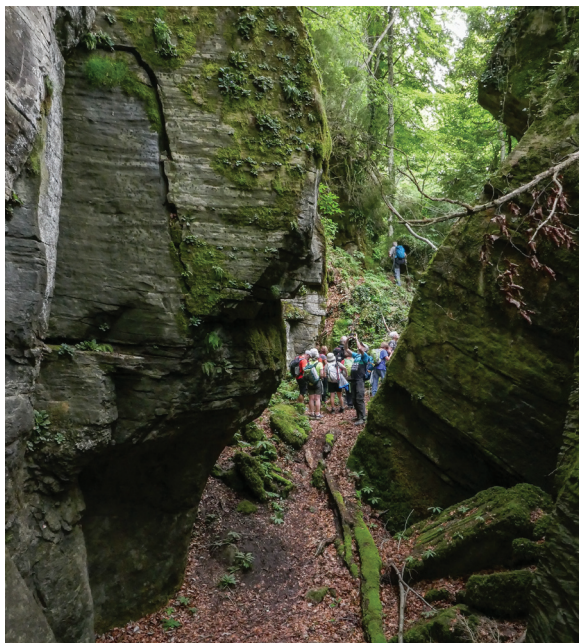
Matinal de cloenda a les Escletxes de l'Euga.