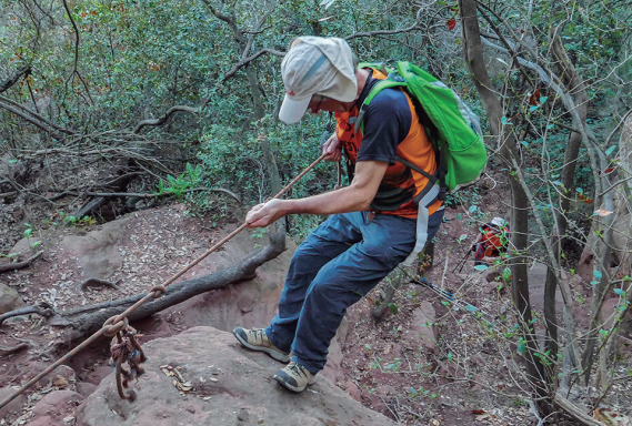
Baixant per la penya del Cucut

cap a l'esquerra en direcció cap a Torrelles. A uns 75 m ens trobarem amb un corriol que surt cap a la dreta i puja a puig Vicenç, en aquest mateix punt surt un altre corriol a l'esquerra que va cap a la penya del Cucut que l'agafarem de tornada. Al començament el corriol puja suaument però després s'enfila de dret fins al cim, observarem que progressivament deixem els gresos vermellosos que ens han acompanyat durant tot el camí i apareixen les calcàries que coronen el cim.