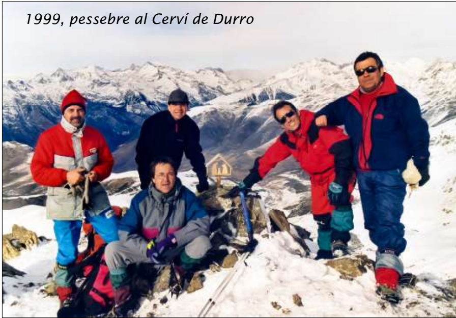
1999, pessebre al Cerví de Durro

bústia de correus, amb relleu d'acer inoxidable. I sempre, passades les festes nadal·lenques, els anàvem a recollir, per tornar a posar-los el l'any següent. L'any 1997 es va instal·lar al cim del Canigó un de construït d'acer inoxidable i, quan vam anar a recollir-lo, havia desaparegut. Pensem que, probablement, va servir per guarnir algun jardí de la Catalunya del Nord. Arran d'aquest incident va sorgir la idea de fer-los de materials que s'autodestruïssin amb les inclemències meteorològiques, estalviant-nos, així, d'anar a recollir-lo.