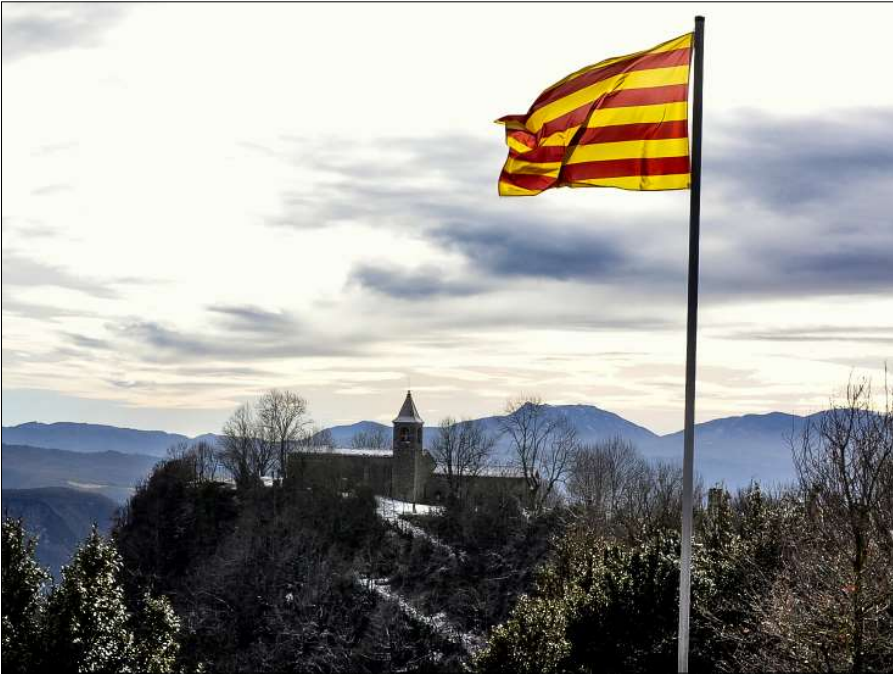
Cabrera, Collsacabra, Osona-Garrotxa.

d'aquell país. També Espanya i Catalunya han tingut episodis d'aquesta mena: creus, plaques i pessebres malmesos, i com a reacció, també accions com la campanya Objetivo 1300, amb l'objectiu de col·locar aquest nombre de creus a les muntanyes espanyoles. D'això ens en parla i hi reflexiona Rafel Folch a l'article Alta montaña, símbolos religiosos y espiritualidad en los Pirineos , publicat a El Inconformista Digital del 22 de desembre de 2015 ( http://www.elinconformista-digital.com/2015/12/22/alta-montana-simbolos-religiosos-y-espiritualidad-en-los-pirineos-por-rafael-folch/ ).