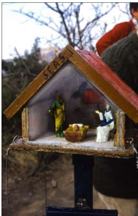
1968, pessebre a la Penya del Moro

A Catalunya, es tenen notícies dels primers pessebres al voltant de l'any 1300. Sabem que a finals del segle XVI ja hi havia pessebres familiars, i l'activitat es va anar escampant ràpidament, tant que el 1786 Barcelona ja tenia la Fira de Santa