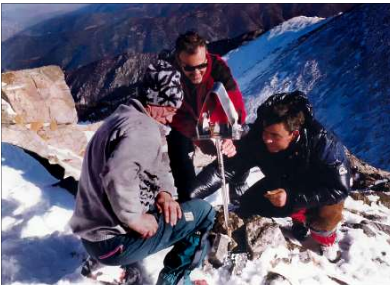
1997, pessebre al cim del Canigó

en desaparèixer aquest grup, vam continuar la tradició els més grans: primer, cinc o sis persones, més tard, 10 o 12, fins al dia d'avui, en què a cada sortida som uns 25 socis. Al principi, sortíem un sol dia; posteriorment es va ampliar a tot el cap de setmana, perquè així dedicàvem un dia a col·locar el pessebre i fer les «restolines», i el següent el combinàvem amb una visita de caire cultural.