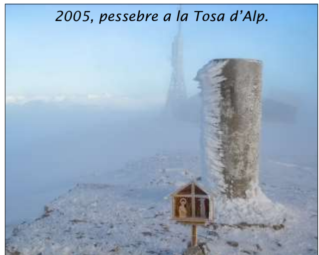
2005, pessebre a la Tosa d'Alp.

La majoria de vegades hem aconseguit arribar a l'objectiu, com l'any 2000 al cim del Casamanya (Andorra), quan vam haver de col·locar el pessebre enmig d'una tempesta de vent i neu, i de tornada, enmig del torb durant més d'una hora, vam estar tan perduts que no sabíem en quina direcció anàvem, però per sort el temporal va minvar i vam poder baixar sants i estalvis al port d'Ordino. Altres cops, com l'any 2014, escollírem anar a climes més temperats. Per no trobar-nos ni neu ni gel,