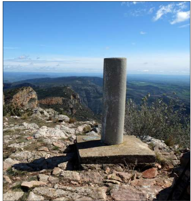
Pala Alta del Mont-Roig, Noguera.

Fem una mica d'història. Hi ha constància de creus en límits fronterers, colls de muntanya o en límits comunals des de l'edat mitjana en diferents punts de l'Europa de tradició catòlica. En aquests llocs, s'usaven sovint creus i no pas fites per la forta identificació religiosa de la seva població. Se sap que a la primera meitat del segle XVII, els habitants d'algunes regi-