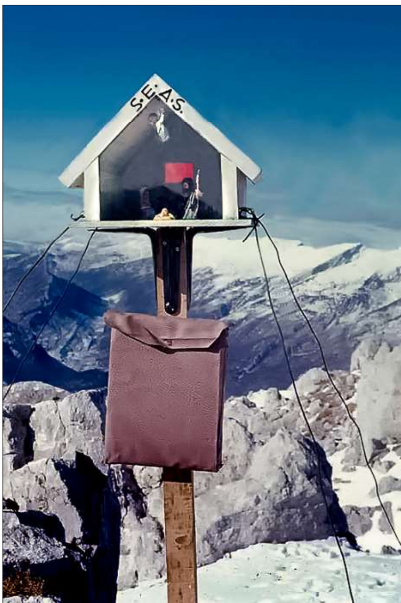
1967, primer pessebre de la SEAS al cim del Pedraforca.

vam passar tantes fatigues i hi vam anar amb cotxes particulars. Després d'haver recollit el pessebre i tot fullejant el llibre de registre, ens hi vam trobar uns escrits on ens deien que als pocs dies d'estar al cim, el pessebre ja havia caigut i que no era el primer pessebre. Per a nosaltres, però, sempre serà el primer pessebre, el qual, retornat a la Secció, es va arribar a aprofitar uns anys més.