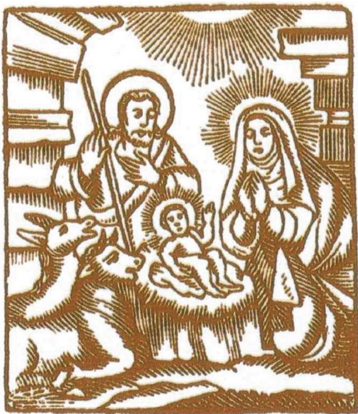
Escena del Naixement segle XIX. Col. J. Amades