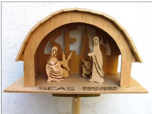
2006, pessebre col·locat a la Muntanya d'Uishera.