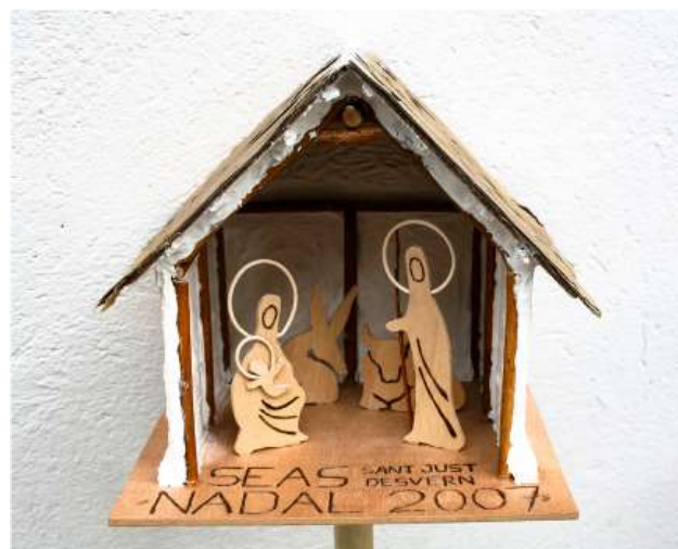
2007, pessebre col·locat al pic de la Torreta de Montsià

— I tant! Heus-ne aquí algunes. Primera. Havent posat el pessebre a la Tossa Plana de Lles (1994), un company tragué un telèfon de la motxilla i trucà a la seva dona per felicitar-la en el dia del seu aniversari. Era el primer mòbil que vèiem a la muntanya. Els companys vàrem restar bocabadats i vam dissertar sobre els futurs avantatges de les noves tecnologies. Segona. La pista de pujada al refugi del Canigó (1997) era totalment glaçada; les cadenes de les rodes dels vehicles tot terreny no es clavaven al gel i es trencaven. Tercera. Baixant del Casamanya (Andorra, 2000), una boira espessa ens va envoltar i ens va desorientar. Vam topar amb un grup de tres homes i una dona, més grans que nosaltres, que havien perdut el camí i estaven amarats de por. Tots vam aconseguir arribar plegats a port. Encara ens estan agraint que els haguéssim salvat la vida. Quarta. Tots els assistents recordem el fred que vam patir una nit eterna al refugi Prat d'Aguiló (2002). Cinquena. A la Pala del Teller (serra de Sant Gervàs, 2004)