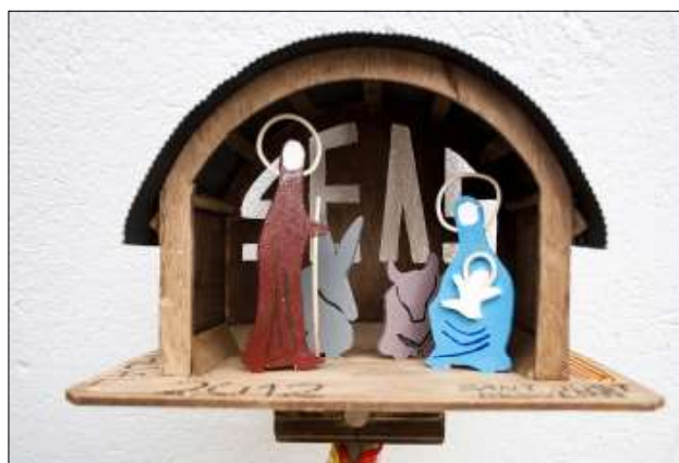
2012, pessebre col·locat al puig Neulós.

els veïns del poble d'Adons, presidits per l'alcalde i el mossèn del Pont de Suert, ens van donar la benvinguda a l'ajuntament i ens van obsequiar amb un generós berenar en agraïment per haver-nos recordat de les seves muntanyes i haver-hi plantat un pessebre.