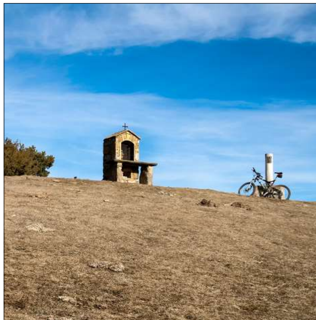
Pedró de Tubau, Berguedà

el testimoni d'una obra i paisatge format pels nostres avantpassats, són símbols de referència per als excursionistes i alhora són el resultat d'una tradició que cal respectar i protegir. Així mateix, el blog https://onehundredmountains.blogspot.com.es/2016/09/ , en una sèrie de cinc articles del setembre de 2016 tracta sobre els orígens de les creus a la muntanya i de diferents actes de destrucció, i comenta l'aparició d'entitats dedicades a reconstruir-les. Parlant de les utilitats de les creus, acoloreix el debat amb una anècdota extreta d'un article aparegut a la revista Die Alpen del Club Alpí Suís: és el cas d'un escalador i del seu guia que en arribar al cim del Weisshorn (4.505 m) van lligar la corda en un braç de la creu per prevenir el risc de caiguda: «Jesús els assegurava mentre reposaven» diu l'articulista. Recordem també el cas del Carrauntoohil, a Irlanda, exposat en un article del passat Butlletí de la SEAS. La destrucció i reconstrucció posterior de la creu va originar alhora tot un debat entre entitats ecologistes i excursionistes