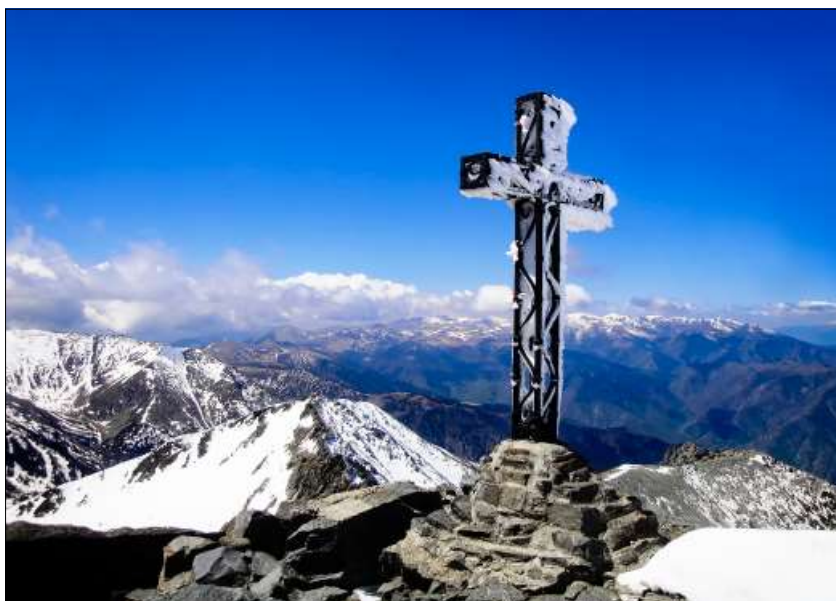
Pica del Canigó.

La instal·lació de símbols a les muntanyes és una pràctica que respon a aquests sentiments religiosos. També és la manifestació d'expressions patriòtiques, de commemoracions o de record de persones. Hi ha creus a alguns dels cims propers més assenyalats, com ara el Canigó, la pica d'Estats, l'Aneto, el Bastiments, el Matagalls o el Puigsacalm,