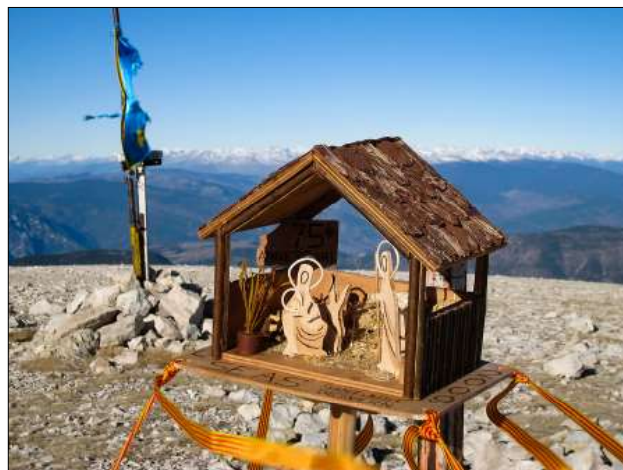
2009, pessebre al Port del Comte.