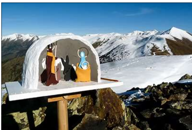
2011, pessebre al pic de Màniga.