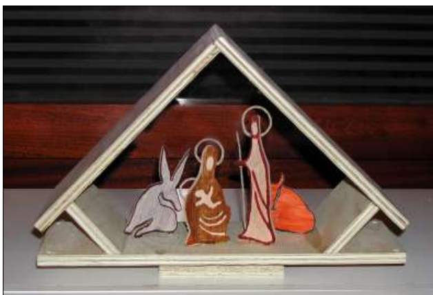
2002, pessebre col·locat al pic Blancor.

fins al 1997 (Canigó). Els pessebres metàl·lics implicaven dues excursions, una per a posar-lo i una altra per a retirar-lo. A partir de l'any 1998 (Puigmal), tant la caseta com les figures ja eren de fullola, un material biodegradable, i el pal d'ancoratge, de fusta. Des d'aleshores, cada edició és una estructura nova i diferent.