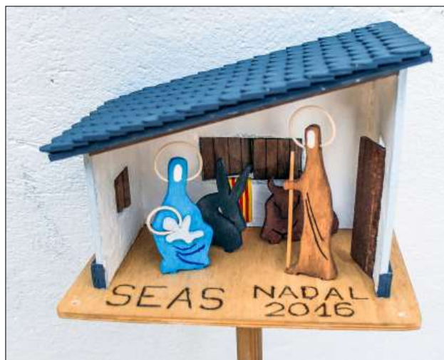
2016, pessebre col·locat al turó Punçó

— Com veus la continuïtat d'aquesta activitat?