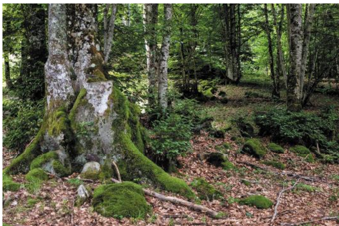
Fageda als entorns d'Orlu

Excursions de Merens a Orgeix i a la vall d'Orlu i anada a Montsegur i Foix (Arieja) 16 i 17 de maig de 2020