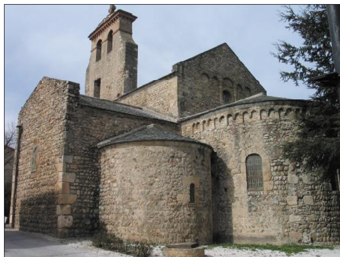
Sant Andreu de Sureda

La curta surt també de La Farga i s'enfila directament al castell d'Ultrera, fent el tram final des del castell fins a Sureda igual que la llarga. Són 9 km i 353 m de desnivell.