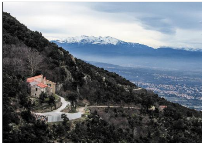
Mare de Déu del Castell