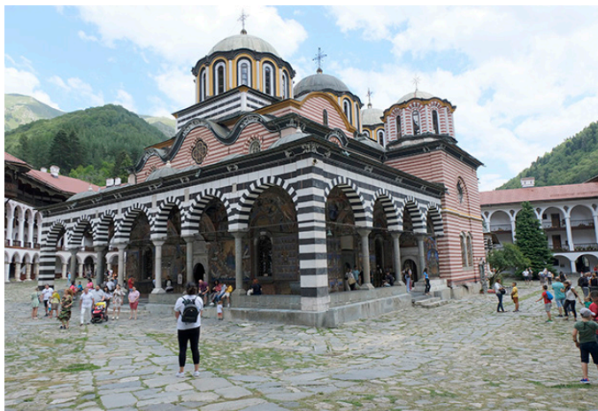
Monestir de Rila.

I ja hem fet tota la pujada per avui. Comencem doncs la baixada, primer per un preciós bosc de verns i després creuant camps on trobem nombroses pruneres plenes de fruits, al seu punt. Encara no hem cremat l'esmorzar, però la temptació de menjar-ne directe de l'arbre pot més. Pel camí passem pel que va ser una escola, datada el 1843. La Denitza ens explica que des del segle XIV fins al XIX Bulgària va estar dominada per l'imperi Otomà, i en aquella època pràcticament els únics que impartien l'ensenyament eren els monjos. Els infants havien de recórrer quilòmetres per anar a una escola com aquesta, immersa enmig del bosc.