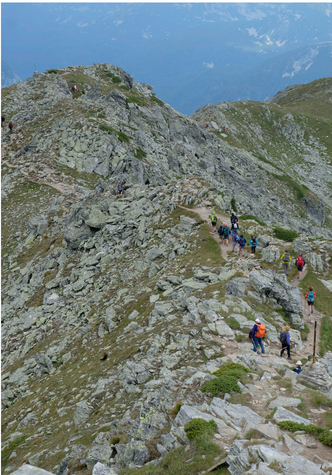
Carena rocosa vers el cim.

A la primera terrassa em sorprèn un monument que és una pedra ovalada en forma de creu (invertint el positiu a negatiu), una mica després, unes plaques en una gran roca en memòria dels muntanyencs vençuts per la muntanya. Ens fa reflexionar.