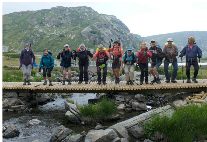
Preparant la clàssica foto del salt conjunt.

El nostre viatge, explicat en aquesta crònica, va consistir en la visita de Sofia durant tres dies (dos al principi i mig dia al final), i sis dies de tresc per les muntanyes de Rila i Pirin.