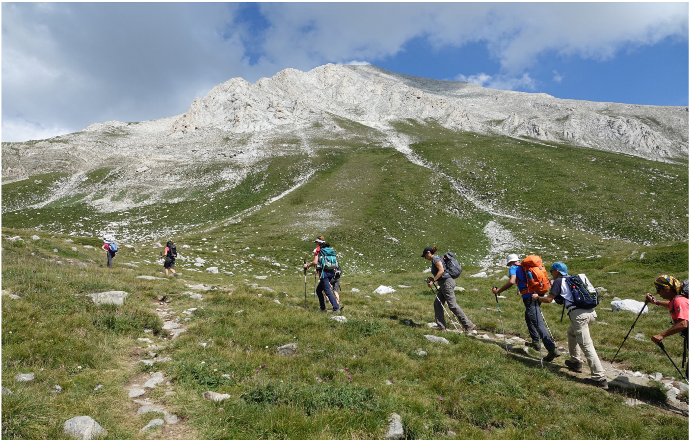
Aproximació al Vihren, al fons.

Podem dividir la pujada en tres trams. Primer caminarem dins del bosc, un camí ple de blocs de volum mitjà, cobert per vegetació que ens manté a l'ombra fent més agradable la feixuga pujada. 300 metres aproximadament. Just aquí la Roser i en Salva decideixen que ells aniran fent i si no fan cim no passa res. Repartim els queviures que portem per dinar i seguim. El següent tram, encara que de caminar més còmode, no deixa descans i encara puja de valent.