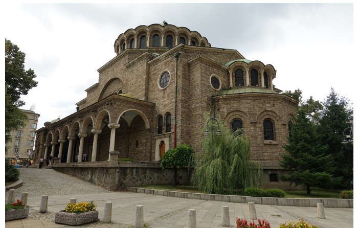
Església Esveta Nedelya.

-Església Esveta Nedelya. Ens trobem que estan a punt de celebrar un enterrament i arriba molta gent amb flors.