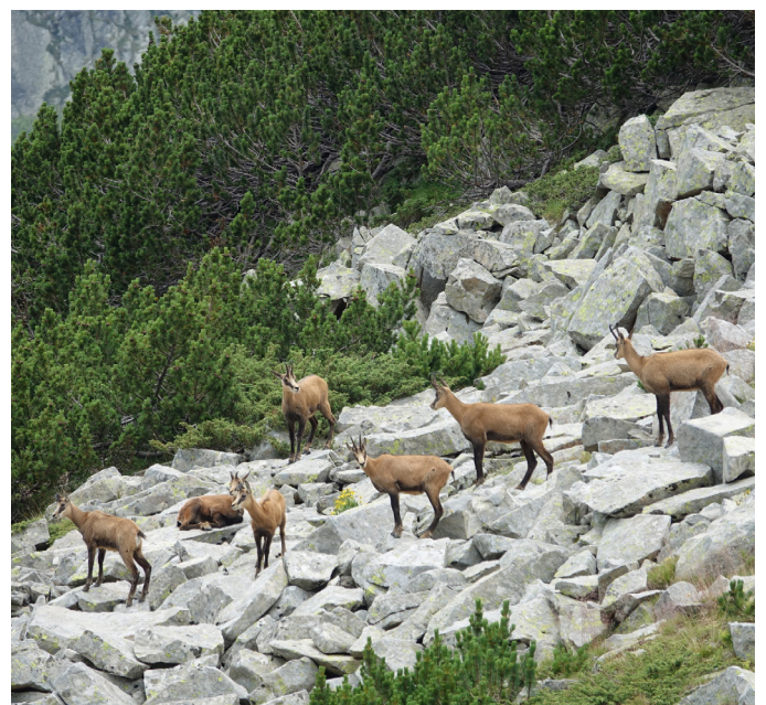
Els isards ens acompanyaren bona part del dia.

Tocava enfilat la llarga baixada de retorn amb parada per dinar al refugi de Demianitza des d'on seguiríem el curs del riu del mateix nom fins al punt de trobada amb la nostra furgoneta.