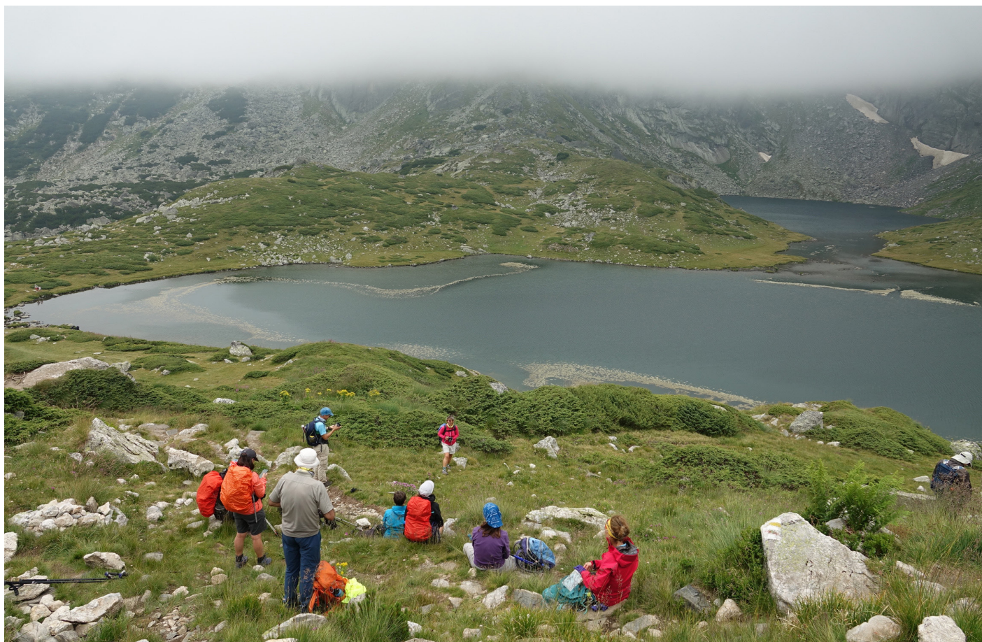
Llac dels Bessons.

Els voltants del refugi està ple de tendes i molta gent arreu. S'ha acabat la tranquil·litat. Sort que no fa bo, ja que podria ser pitjor.