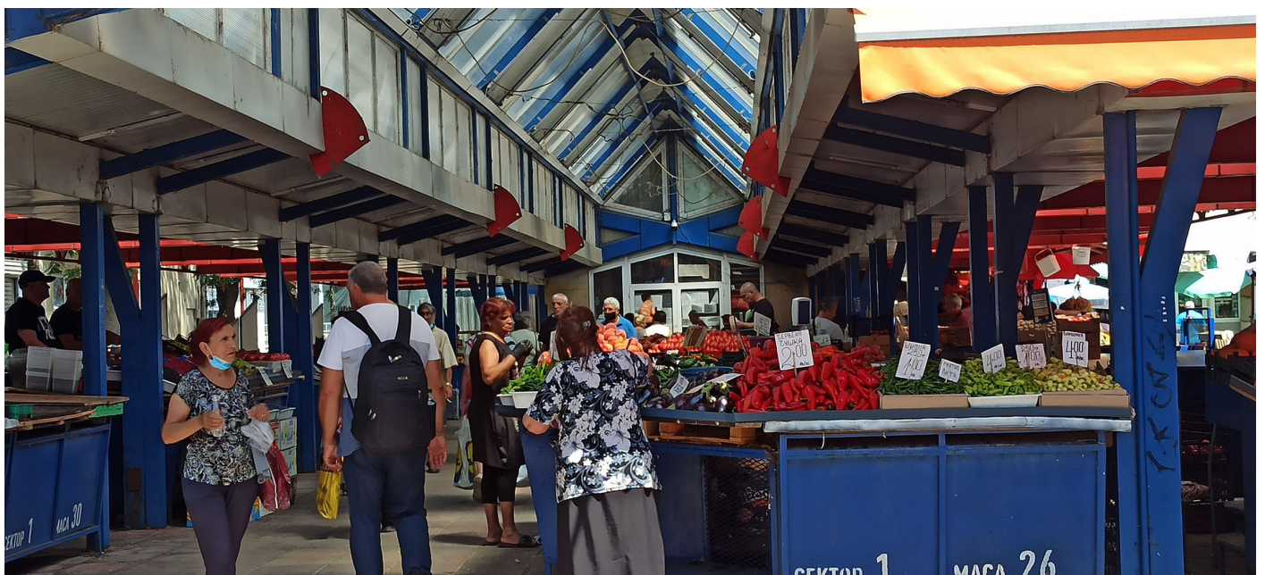
Mercat de les Dones.

Per sorpresa arriba la Denitza, però no és l'hora encara de trobar -nos i ella té altres coses a fer. Fa un cafè en una altra taula.