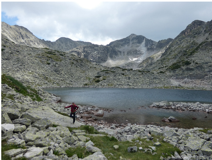
Un dels molts llacs que passarem (Musalenski). Al fons el nostre objectiu, el Musalà.

A l'arribar al pic la gentada és increïble, cal fer cua per fer-se la foto a la fita!!! Ho aconseguim i ens la fem, com no, amb l'estelada. Instal·lats en un prat del cim fem el primer pícnic que la nostra estimada guia Denitza ens ha fet preparar: un "burrito" ple de llegums i arròs amb curri i altres espècies. Ho trobem boníssim!!! Des d'allí, tot menjant, gaudim d'unes vistes increïbles.