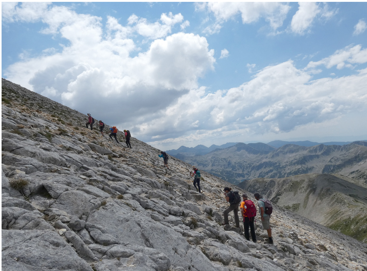
El tram rocós que ens duria el cim va ser dur.

Acabat l'àpat seguim la baixada, alguns més ràpids que d'altres, la cerveseta fresca crida. Al refugi de Vihren ens espera en Niqui amb el bus a punt per tornar cap a Sofia, però primer hem de fer una aturada a Bansko per deixar en Nicolas, ell i la Sasha que avui no ha vingut amb nosaltres van a Sofia amb el seu cotxe. Arribem a Sofia a l'hotel Budapest, (sempre queda bé dir el nom quan vas a un hotel pijo), dutxa i sortim a sopar a un restaurant típic. Àpat d'aquells que no t'acabes. Cansats i tips anem a dormir, demà ens espera acabar de descobrir aquesta mítica ciutat i agafa el vol de tornada.