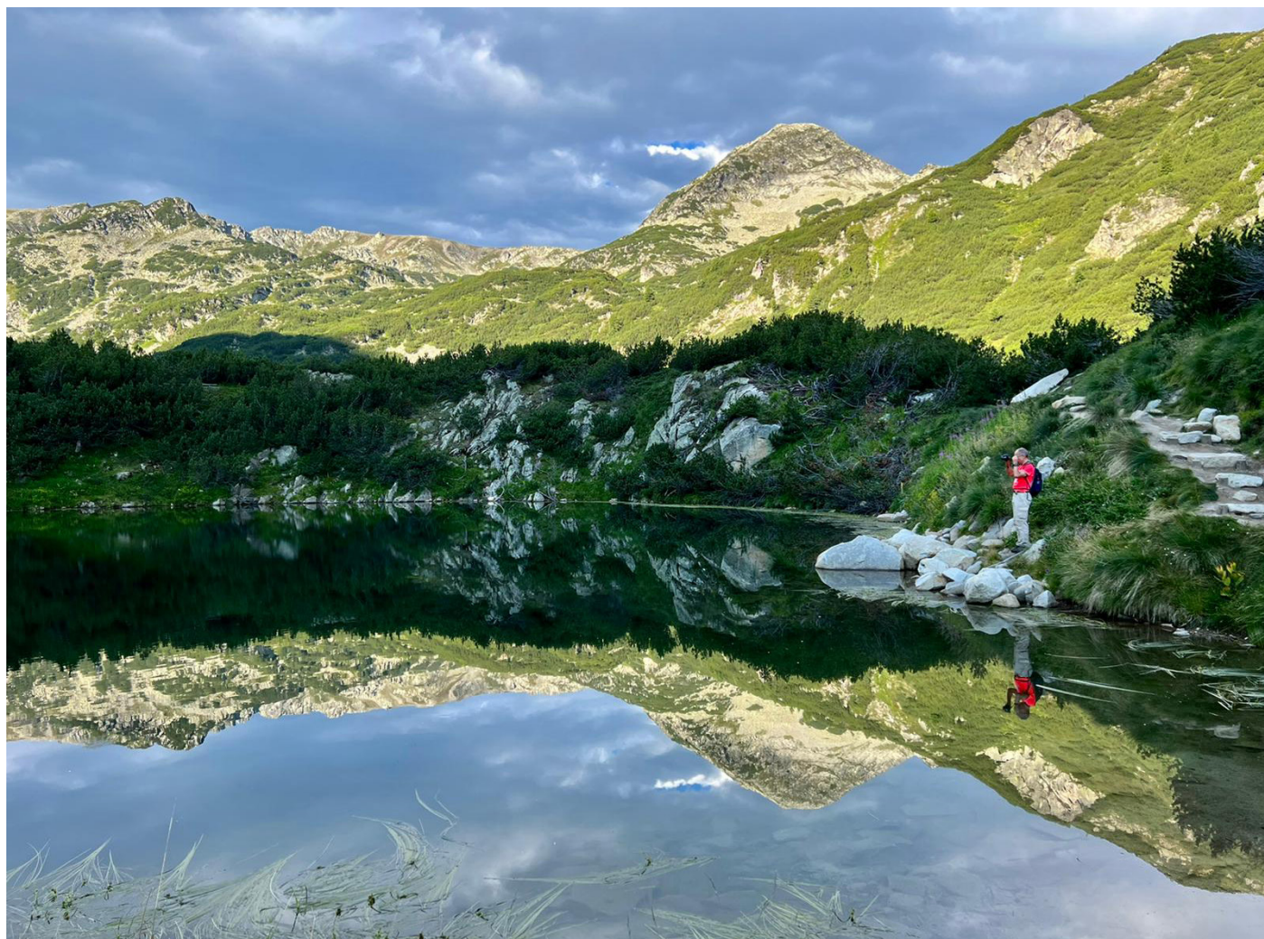
Llac Okoto (L'ull).

Amb els cabells humits de la dutxa recent i amb un molt ben dissimulat posat de naturalitat envers la nova situació, ens disposàvem a degustar, per fi, les populars banitza de formatge. Un tradicional pastisset farcit habitualment de formatge, omnipresent a totes les pastisseries del país. Amb això i una nova ració de la mel del Victor, que des del Musalà acompanyava tots els nostres esmorzars, estàvem apunt per la nostra nova ruta.