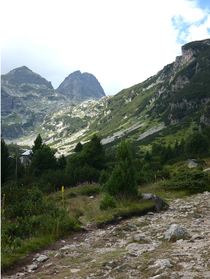
El Malyovitsa al fons.