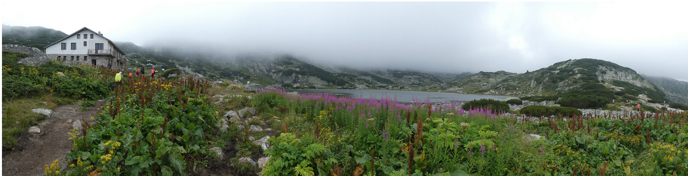
El segon dels 7 llacs de Rila, el llac "peix" (Ribnoto ezero), vora el refugi (xalet Sedemte ezera).

Un cop més, un grup de bons amics units per la muntanya, hem aprofitat les vacances per caminar més enllà de les nostres fronteres, gaudir de paisatges diferents i conèixer nova gent. Aquest cop, l'objectiu ha estat Bulgària.