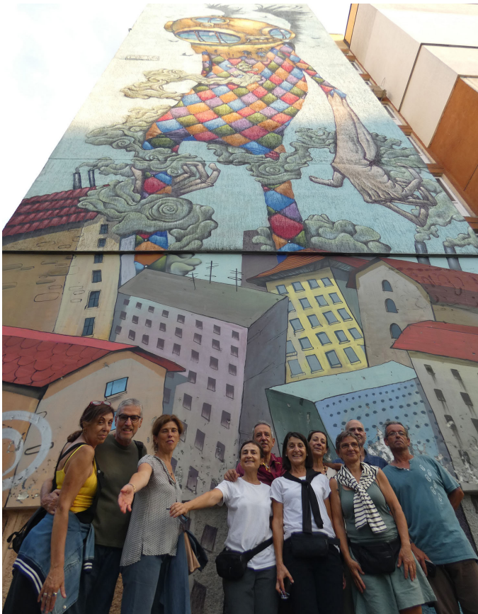
Un dels graffits de la capital.

Mentre esperem l'hora d'entrada, fem quatre fotos gracioses ja que els nostres nois es van dedicar a fer postures. A dins hi trobem uns frescos espectaculars dels segles XI i XII.