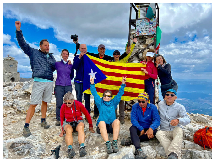
Els dos cims culminants de les serralades de Rila i Pirin. Respectivament, el Musalà (2.925 m) i el Vihren (2.914 m).