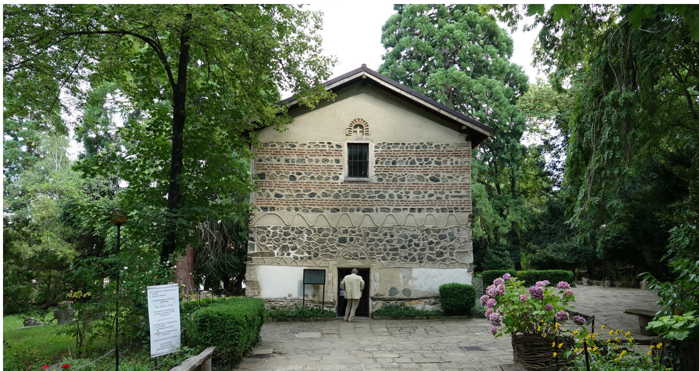
Església de Boyana, als afores de Sofia, al barri del mateix nom. La varem visitar el primer dia.