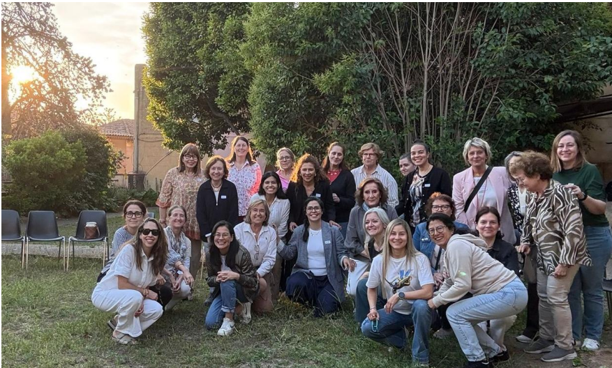
Reunió mensual del mes de mayo, mes de María